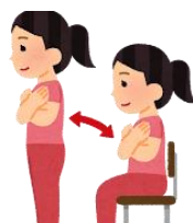
いす 椅子を使ってスクワット