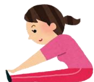
こし 腰、おしり、尻 太ももうらがわ