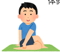
おしりと 尻 太もも